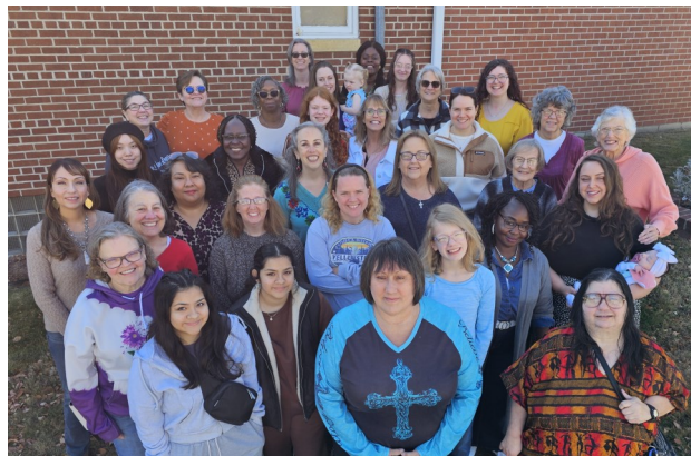
Algunas de las asistentes a la conferencia "Comprometidas con Cristo"- Rochester CoC - 26 de octubre de 2024

Cuarenta mujeres de dos congregaciones de las Ciudades Gemelas se reunieron para el taller de fin de semana organizado por la Iglesia de Cristo de Rochester en Minnesota.