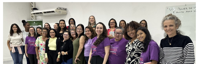
Damas en nuestra clase en el Seminario Teológico EBNSER, Recife, Brazil

¡A Dios sea la gloria mientras nos esforzamos por ayudar a las mujeres a acercarse más a Dios y a las demás!