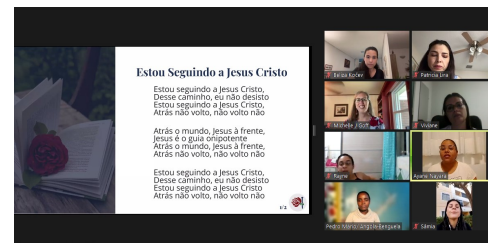
Asistentes al evento virtual cantando “He decidido seguir a Cristo” en portugués

conocí el año pasado en Angola cuando el MHRH fue invitado a impartir una serie de clases bíblicas para mujeres durante el encuentro luso-africano. ¡Qué alentador es que brasileñas y africanas aprendan juntas en portugués!!