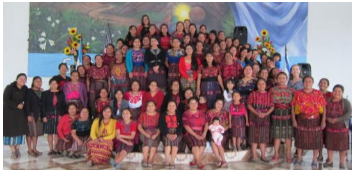
Más de 70 hermanas quiche reunidas para aprender de Filipenses, en Chichicastenango, Guatemala

Qué gozo volver a conectar con las mujeres que asistieron el año pasado y conocer a otras hermanas. Mujeres líderes de quince