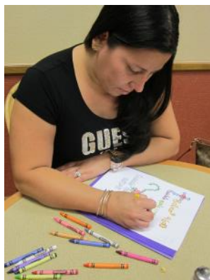
Meditando en Salmo 46:10

En abril, tres fines de semana seguidos, estaba manejando a diferentes