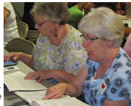
Hermanas de la Iglesia de Cristo en Longmont, CO

Ministerio Hermana Rosa de Hierro es facilitar oportunidades tales como las antes mencionadas en Tegucigalpa y Longmont—equipando a mujeres a conectarse más profundamente con Dios y con otras hermanas.